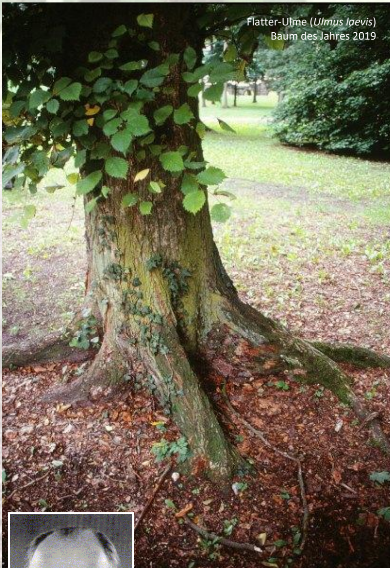
Flatter-Ulme ( Ulmus laevis ) Baum des Jahres 2019