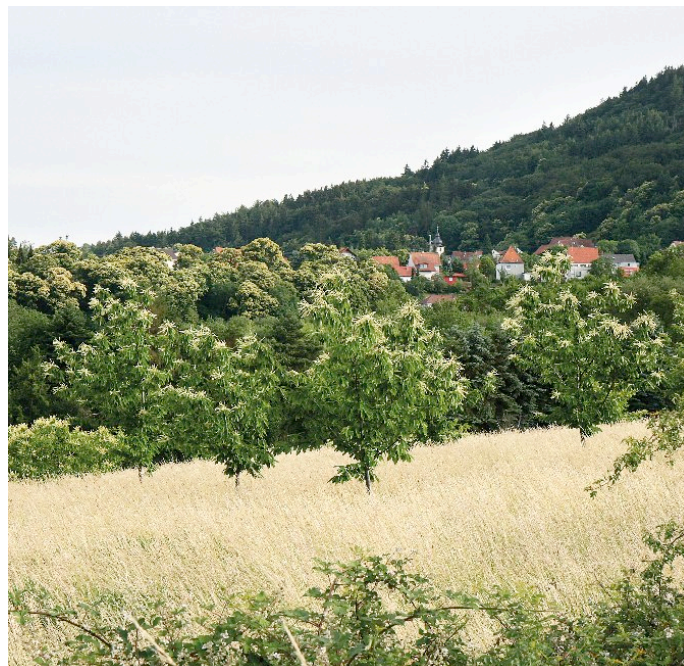
Pflegebedürftig: Edel-Kastanien-Sortengarten, nördlich von Dannenfels

► schen Weinstraße kennen wir nur noch wenige Selven dieser Qualität (so zum Beispiel in Freinsheim). Dort wurde die Edel-Kastanie zugunsten des Weinbaus von den besseren siedlungsnahen Standorten verdrängt.