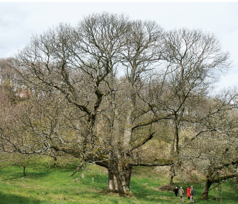
Edel-Kastanie in der Golddelle (6,70 Meter Stammumfang in 2011)