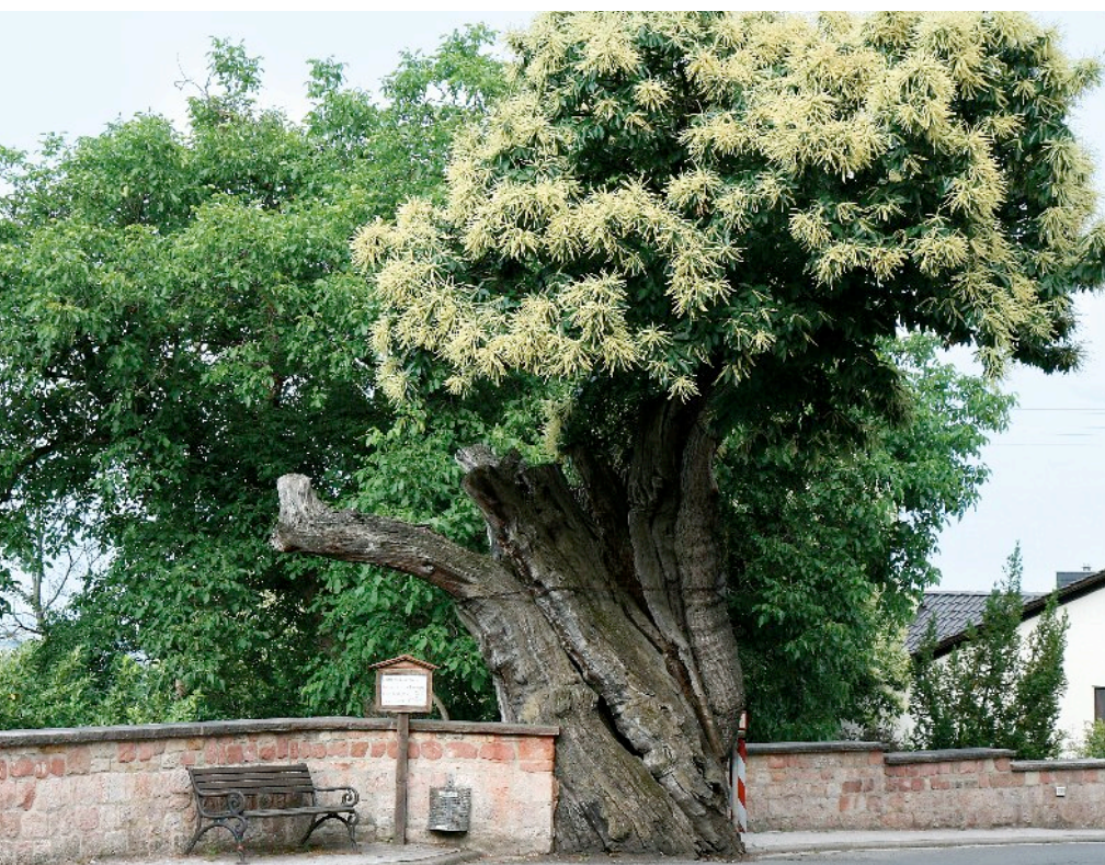
Frühjahr 2011 setzte die Blüte der „Dicke Keschde“ bereits Ende Mai/Anfang Juni ein. Ausschlaggebend für die Wahl zum Champion Tree war das hohe Alter des Baumes, das auf mindestens 400 Jahre geschätzt wird.

Anhand eines von Martin Neussel (Universität Trier) 2010 im Rahmen des Interreg IVA-Oberrhein-Projektes „Die Edelkastanie am Oberrhein – eine Baumart verbindet Menschen, Kulturen und Landschaften“ erstellten Luftbildes, konnten die den Ort umgebenden blühenden Kastaniengärten beziehungsweise „Keschdegärde“ und Obstkulturen gut lokalisiert werden. Es gibt in Deutschland nur noch wenige so gut erhaltene in Reih und Glied ihrer Früchte wegen angelegte „Selven“. An der Haardt/Deut-